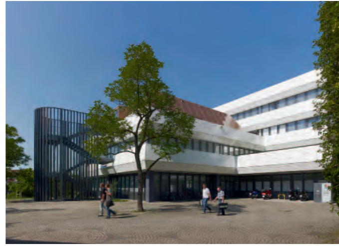
Landratsamt Nürnberger Land, Lauf a. d. Pegnitz