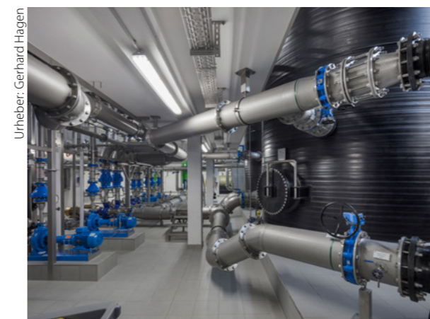
PE-Zwischenbehälter mit Entnahme- und Übereichleitungen

Die bestehenden 18 Brunnen wurden durch Regeneration ertüchtigt, um die gewinnbare Rohwassermenge von 84 l/s auf 90 l/s (18 Brunnen je 5 l/s) zu steigern. Zur Abdeckung des prognostizierten Spitzenbedarfes von 7000 m 3 /d besteht bei Bedarf die Möglichkeit, im Gewinnungsgebiet zusätzliche Brunnen niederzubringen. Die Aufbereitung im Wasserwerk Weyer wurde umgebaut und erweitert. Die neue Aufbereitung im Wasserwerk Weyer ist konzipiert für eine Rohwasser-Durchsatzleistung von bis zu 120 l/s. Aufbereitungsziel ist ein Reinwasser, das alle Anforderungen der TrinkwV erfüllt und zusätzlich mit den