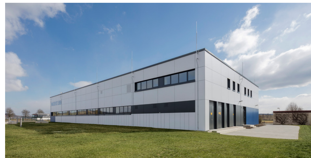
Außenansicht Wasserwerk Weyer

Durch den geplanten Verzicht auf die Grundwasser-