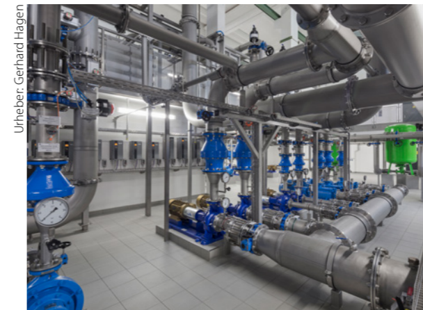
Pumpengalerie im UG für Rückspülung und Förderpumpen