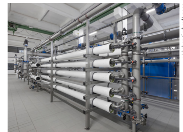
Dreistraßige Nanofiltration im EG (Druckmembrananlage)