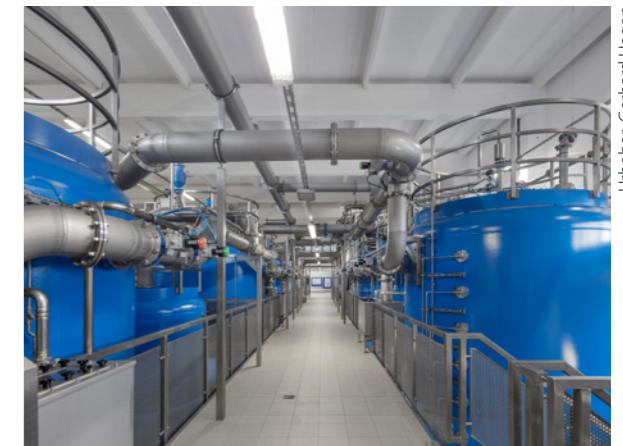
Bediengang Filterhalle mit Enteisungs-, Entmanganungs- und Aktivkohlefilter

anreicherung war mit einer Aufhärtung des gewinnbaren Rohwassers zu rechnen, die eine zentrale Enthärtung des Wassers erforderlich macht. Um die Ergiebigkeit der Gewinnung ohne Anreicherung und die Zusammensetzung des dann gewinnbaren Rohwassers abzuschätzen, wurde im Spätherbst 2009 ein zweimonatiger Dauerpumpversuch im Gewinnungsgebiet bei Einstellung der Mainwasseranreicherung durchgeführt.